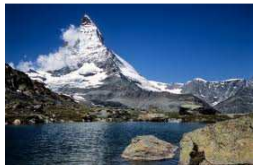
das Wahrzeichen, -, - symbol

Man sagt, „die Quellen Europas liegen in der Schweiz“. Weil verschiedene europäische Flüsse haben in der Schweiz ihre Quellen z.B. der Rhein, die Rhone oder der Inn, der später in die Donau fließt. Der Rhein fließt in die Nordsee, die Rhone ins Mittelmeer und die Donau ins Schwarze Meer.